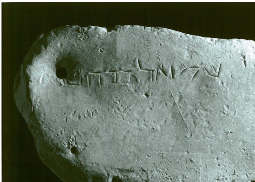
FIGURA 2. Plom de ses Fontanelles núm. 2 (Museu de Mallorca, núm. 15356)