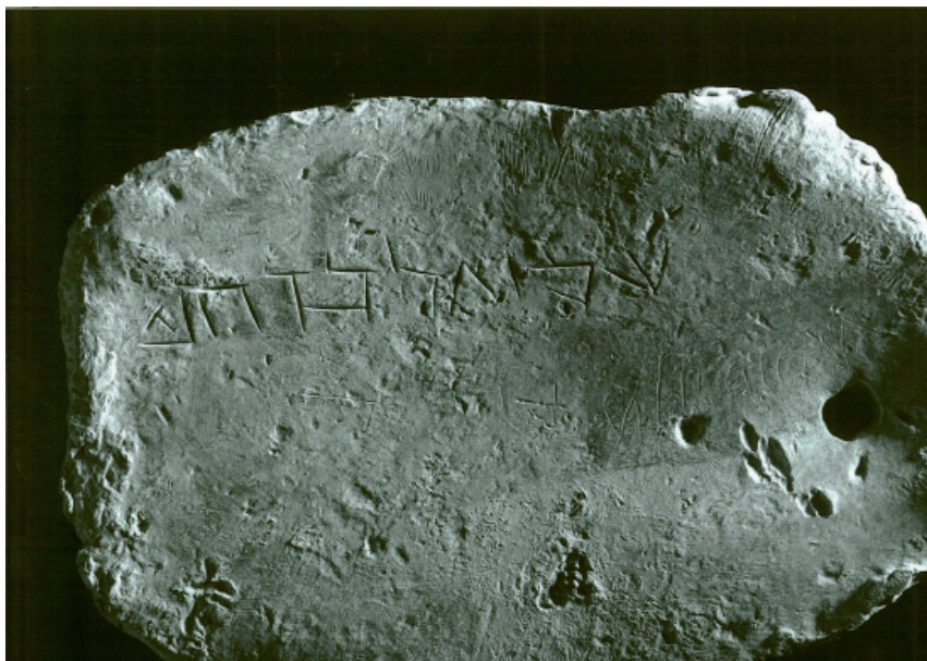
FIGURA 1. Plom de ses Fontanelles núm. 1 (Museu de Mallorca, núm. 15355)