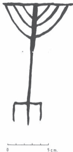
FIGURA 4. Menorà de Tarragona (Museu Nacional Arqueològic de Tarragona. núm. 45183)

Trobem representacions de la menorà properes en l'espai i en el temps a la de Mas Rimbau en la inscripció trilingüe de Tortosa (segle VI), 29 en la pila trilingüe de Tarragona (segle VI), 30 en l'epitafi de Lasies, també de Tarragona (segles VI-VII), 31 en la làpida