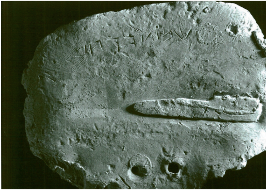
FIGURA 3. Plom de ses Fontanelles núm. 3 (Museu de Mallorca, núm. 15357)

Plom 3 (figura 3) (Museu de Mallorca, núm. 15357). És el més irregular de tots, no sols per la forma ans també pels acabats (superfície de la cara epigràfica poc polida). 41 × 24 cm. Dos orificis es concentren en la part inferior central. Camp epigràfic: 16 × 2 cm.